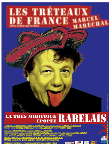
Affiche de La Très mirifique épopée Rabelais .