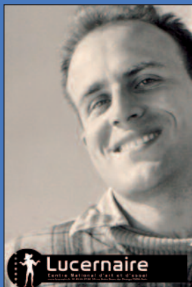
BORIS VIAN JUSTE LE TEMPS DE VIVRE BOURGEAT / JACOPIN LUCERNAIRE

du 12 janvier au 27 février 2010 01 45 45 49 77