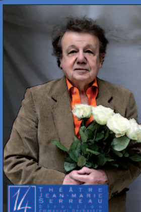
ONCLE VANIA TCHEKHOV / MARÉCHAL THÉÂTRE 14

Quelques jours plus tard, à partir du 17 novembre, toujours avec Molière nous étions à Prague au moment où le pays basculait après les sanglantes répressions. Vaclav